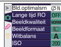
Menu's voor de update

Het ontwerp van de cameramenu's is gewijzigd om de leesbaarheid te verbeteren.