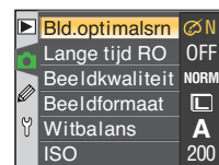
Menu's na de update