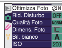
Menu prima dell'aggiornamento

La rappresentazione grafica dei menu è stata ridisegnata per una più facile lettura.