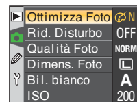
Menu dopo l'aggiornamento